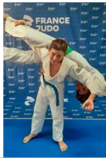
12 ans et plus