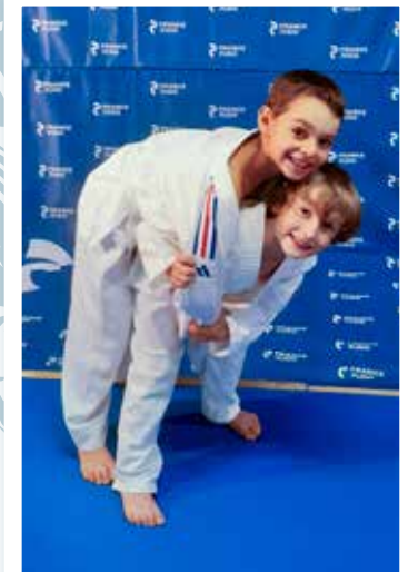
6 - 11 ans Vendredi