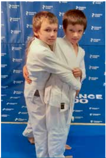
6 - 11 ans Mercredi