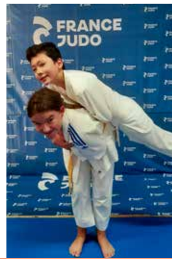
12 ans et plus