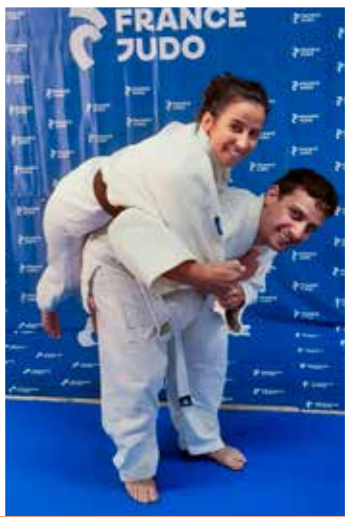
12 ans et plus