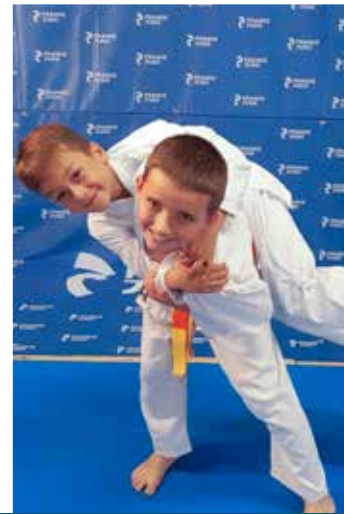
6 - 11 ans Mercredi