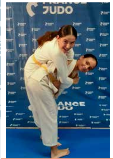
12 ans et plus