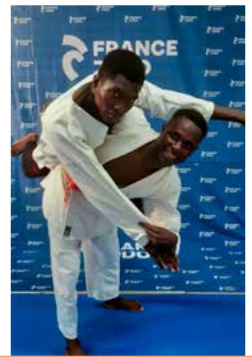
12 ans et plus