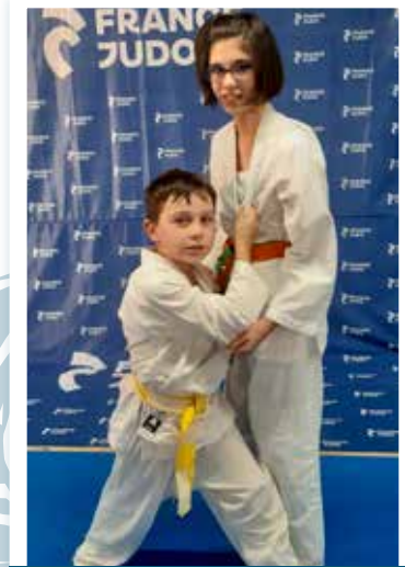
6 - 11 ans Mercredi