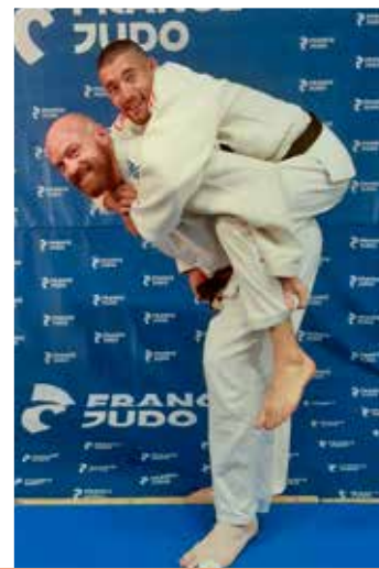
12 ans et plus