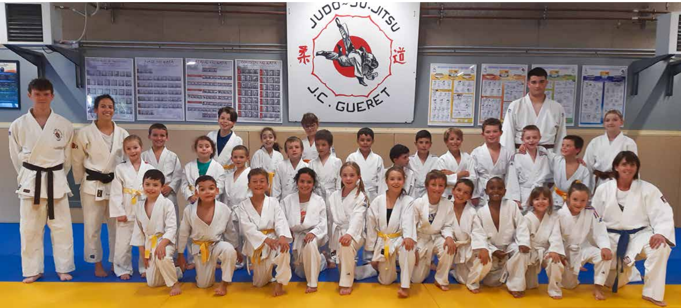
6 - 11 ans Groupe du mercredi