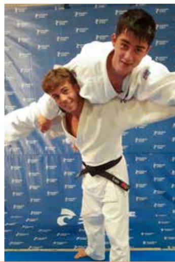
12 ans et plus