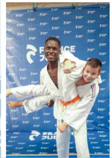
12 ans et plus