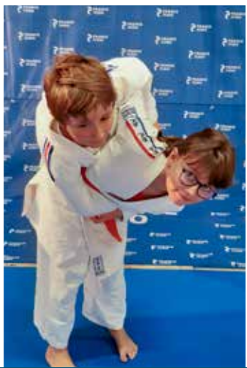
6 - 11 ans Mercredi