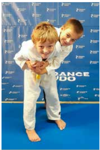
6 - 11 ans Vendredi