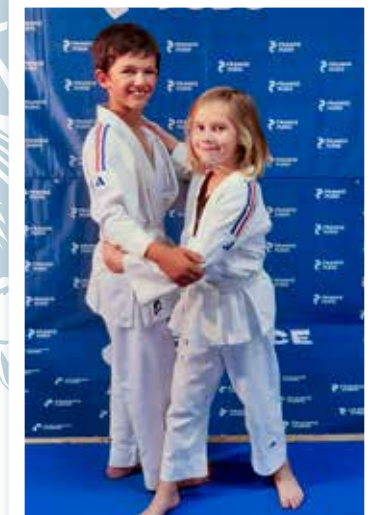
6 - 11 ans Vendredi