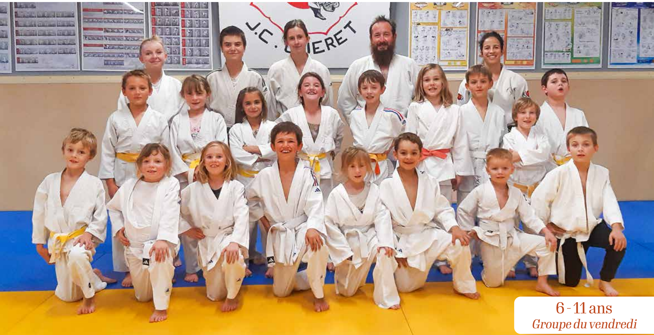
6 - 11 ans Groupe du vendredi