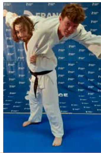
12 ans et plus