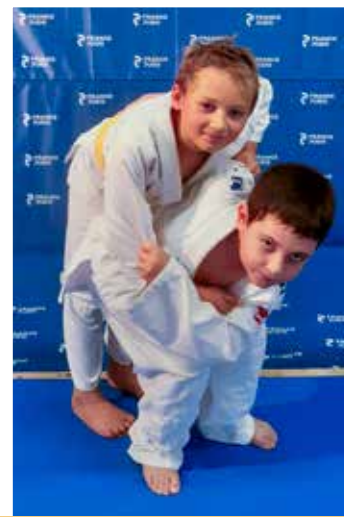
6 - 11 ans Vendredi