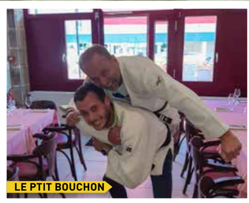
LE PETIT BOUCHON