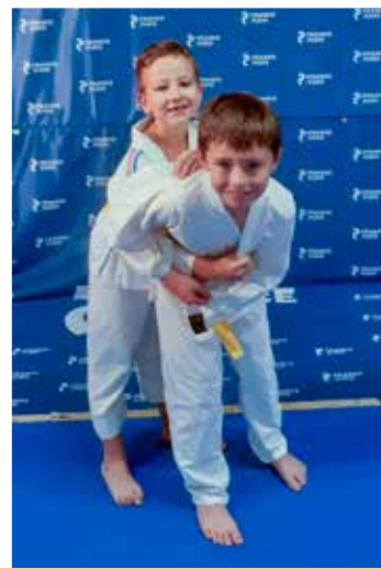
6 - 11 ans Vendredi