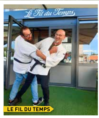
LE FIL DU TEMPS