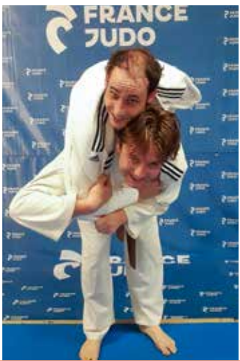
12 ans et plus