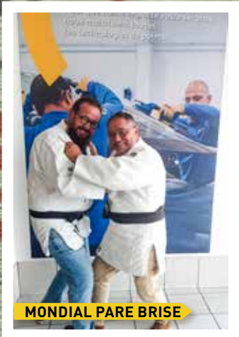
MONDIAL PARE BRISE