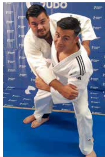
12 ans et plus