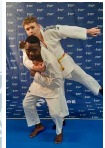
12 ans et plus