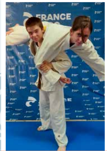
12 ans et plus