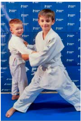
6 - 11 ans Vendredi