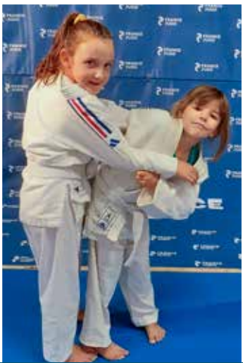
6 - 11 ans Mercredi