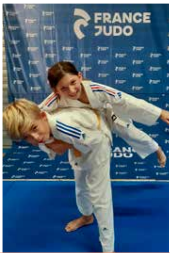
12 ans et plus