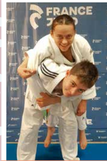
12 ans et plus