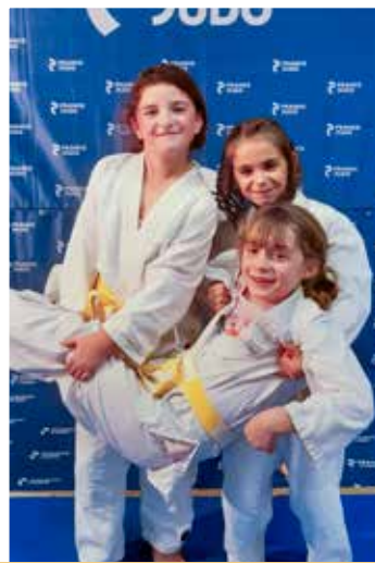
6 - 11 ans Vendredi