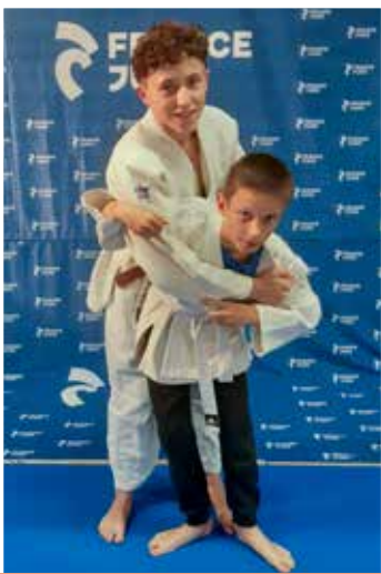
12 ans et plus