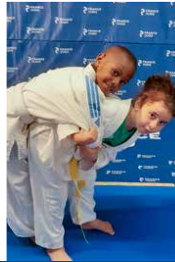
6 - 11 ans Mercredi