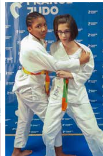
6 - 11 ans Mercredi