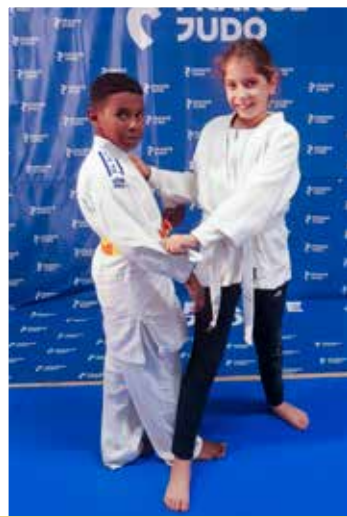
6 - 11 ans Vendredi