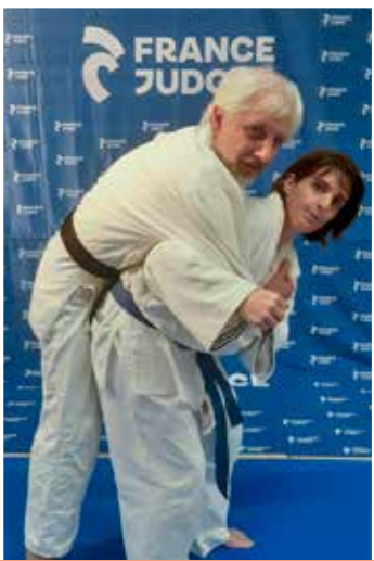
12 ans et plus