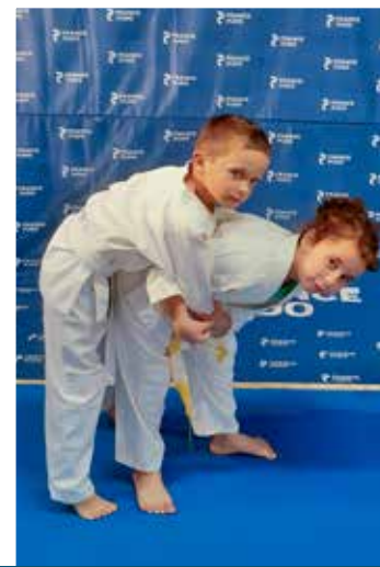
6 - 11 ans Mercredi