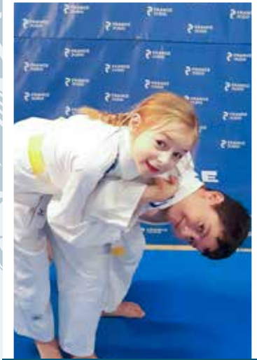
6 - 11 ans Mercredi