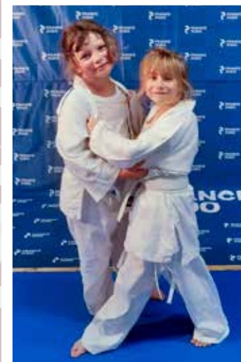
6 - 11 ans Vendredi