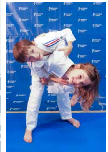
6 - 11 ans Vendredi