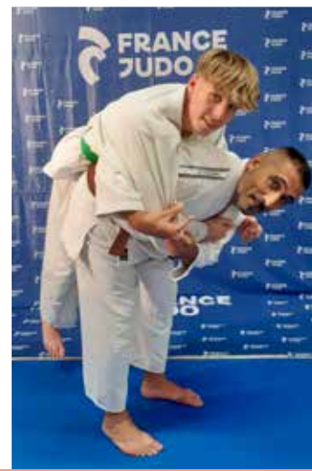
12 ans et plus