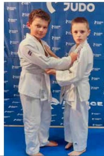
6 - 11 ans Mercredi