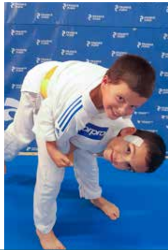
6 - 11 ans Mercredi