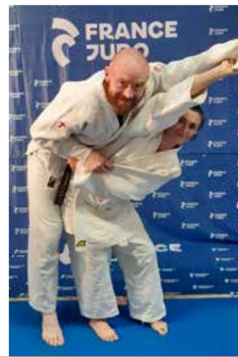
12 ans et plus