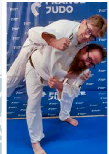
12 ans et plus