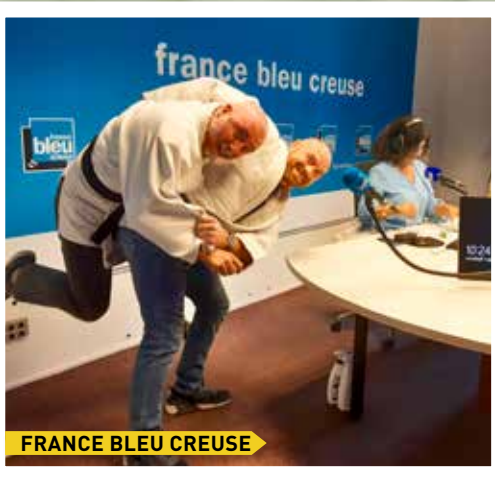
FRANCE BLEU CREUSE