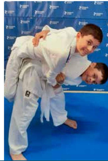
6 - 11 ans Mercredi