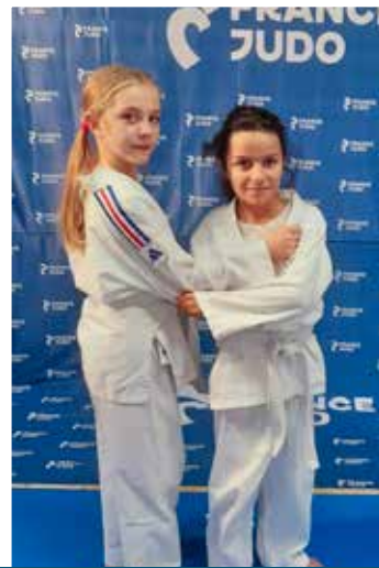
6 - 11 ans Mercredi