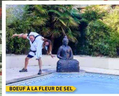
BOEUF À LA FLEUR DE SEL