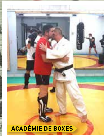
ACADÉMIE DE BOXES