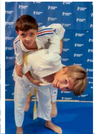
6 - 11 ans Mercredi