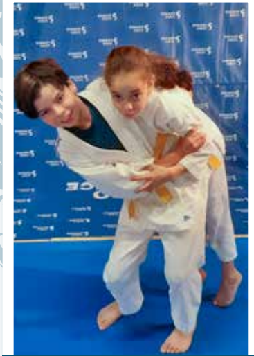
6 - 11 ans Mercredi