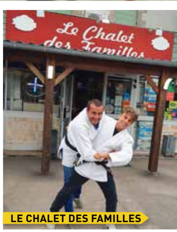
LE CHALET DES FAMILLES