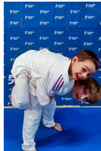
6 - 11 ans Vendredi